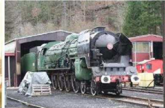
Etat actuel de la machine à St Sulpice