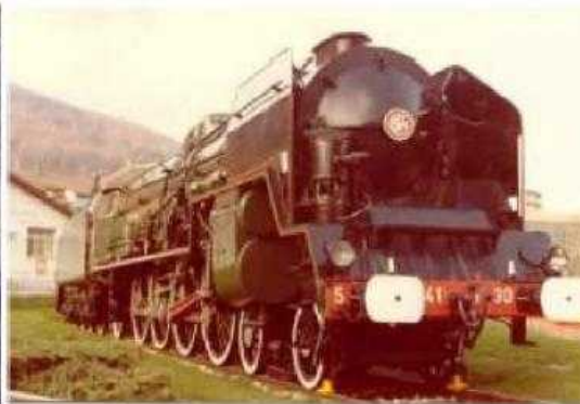
En monument à Vallorbe 1972-1997