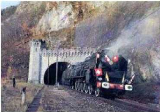
Arrivée à Vallorbe en 1972

En faisant un don à l'AJECTA. La contribution à notre œuvre d'intérêt général permet à nos généreux bienfaiteurs de bénéficier d'une réduction d'impôts, sous réserve du contenu des lois de finances futures.