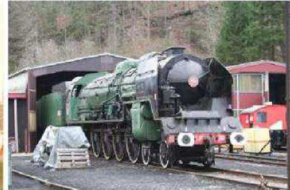
Etat actuel de la machine à St Sulpice