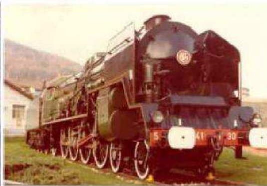
En monument à Vallorbe 1972-1997