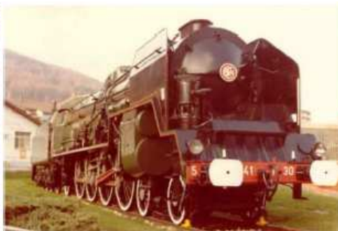
En monument à Vallorbe 1972-1997