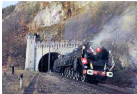
Arrivée à Vallorbe en 1972

En juillet 1999, elle fut déplacée par rail à Pratteln (Suisse). En 2003, le Vapeur val de Travers (VVT), se porte acquéreur de la machine qui, en juillet de la même année, est remorquée jusqu'au dépôt du VVT à St Sulpice près de Neuchâtel.