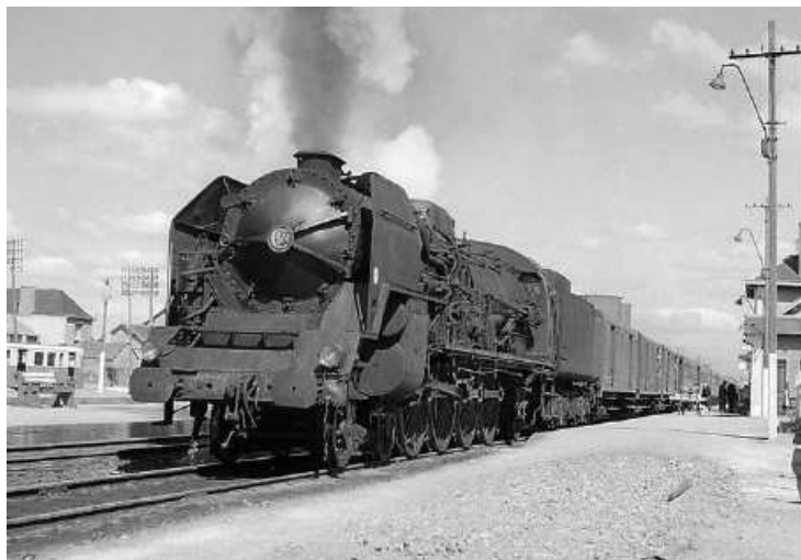
241P 30 - Rosporden - 28 juillet 1968