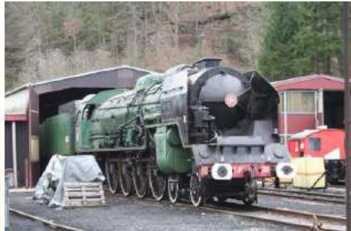
Etat actuel de la machine à St Sulpice