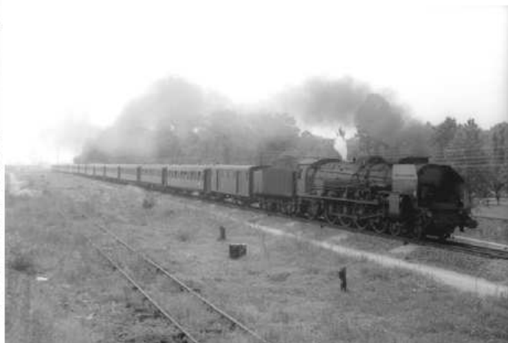
241P 30 - Nantes - 31 juillet 1968

Cette magnifique locomotive, du type 241 « Mountain » a été construite en 1951 pour le compte de la SNCF par les Ets Schneider au Creusot. Appartenant à une série de 35 machines, la 241P 30 est à ce jour stationnée à St Sulpice dans le Jura Neuchâtelois en Suisse, et est propriété du Chemin de fer Vapeur-Val de Travers (VVT) qui souhaite s'en séparer.